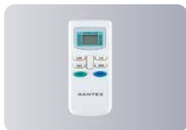
Функциональный пульт ДУ 05E