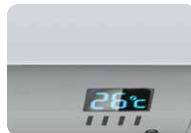
Дисплей на передней панели