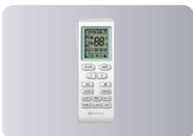
Функциональный пульт ДУ YB1FA