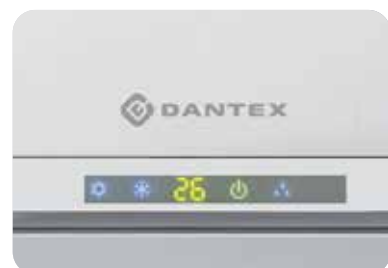
Дисплей на передней панели