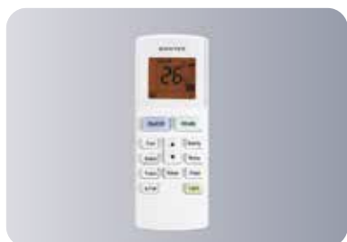
Функциональный пульт ДУ YAW1F