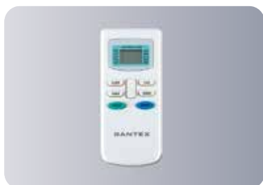
Функциональный пульт ДУ 05E