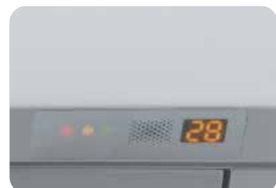
Дисплей на передней панели