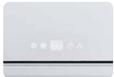
Скрытый дисплей передней панели