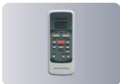
Функциональный пульт ДУ R51