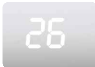
Скрытый дисплей передней панели