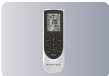
Функциональный пульт ДУ YV1FA (MOTO)