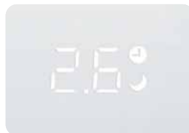
Скрытый дисплей передней панели